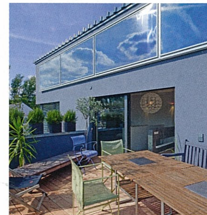
Geschmückt mit Palmen, Bäumchen und anderen Grünpflanzen geht von der Sonnenterrasse ein mediterranes Flair aus.

fassade des Hauses montiert, die der Brauchwassererwärmung dienen und die Fußbodenheizung unterstützen. Zum Schutz gegen Elektrosmog wurden spezielle Wandplatten eingesetzt und Leitungen abgeschirmt.