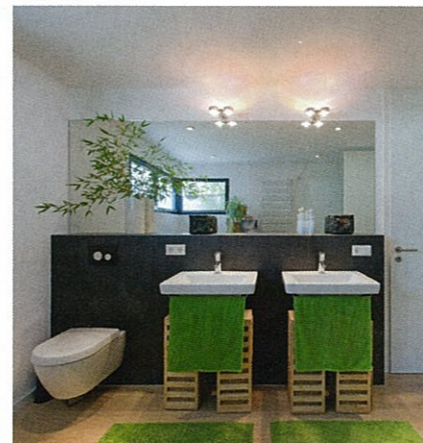
Stilvoll eingerichtet: Das Badezimmermobiliar wurde harmonisch in Form und Farbe aufeinander abgestimmt.