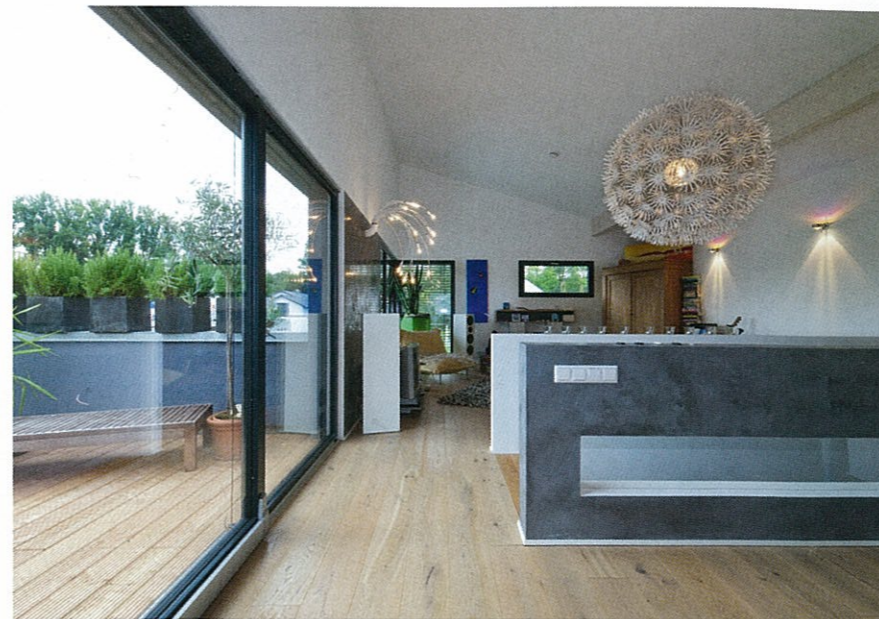
Für Überraschungen sorgt das Haus im Innern: Die Gemeinschaftsräume wurden entgegen dem klassischen Konzept im Obergeschoss untergebracht – mit Zugang zur großen Dachterrasse auf dem Anbau. Das Privatreich befindet sich dementsprechend auf der unteren Ebene.

Das Erdgeschoss wurde im Prinzip in drei Trakte untergliedert: Im einen befinden sich die Büroräume mit Gäste-Duschbad, im anderen das Jugendzimmer und im dritten das Elternschlafzimmer mit direktem Zugang zu einem Wellnessbad mit Dusche und Badewanne. In geselliger Runde trifft sich die Familie im Obergeschoss, wo eine gemütliche Wohncke Raum zum Erholen bietet, die über die Dachterrasse mit Holzdielen eine Erweiterung im Freien erfährt. An die zum Essbereich hin offene Küche schließt eine Kammer und in ihrer Flucht ein Waschraum an, der gleichzeitig die Haustechnik beherbergt. Neben einer außergewöhnlichen Architektur und einem ausgefeilten Design legten die Hausherren aber auch großen Wert auf Ökologie und eine gesunde Lebensweise. So wurden nicht nur in großzügigem Maßstab natürliche Materialien verbaut, sondern auch Solarkollektoren an der Süd-